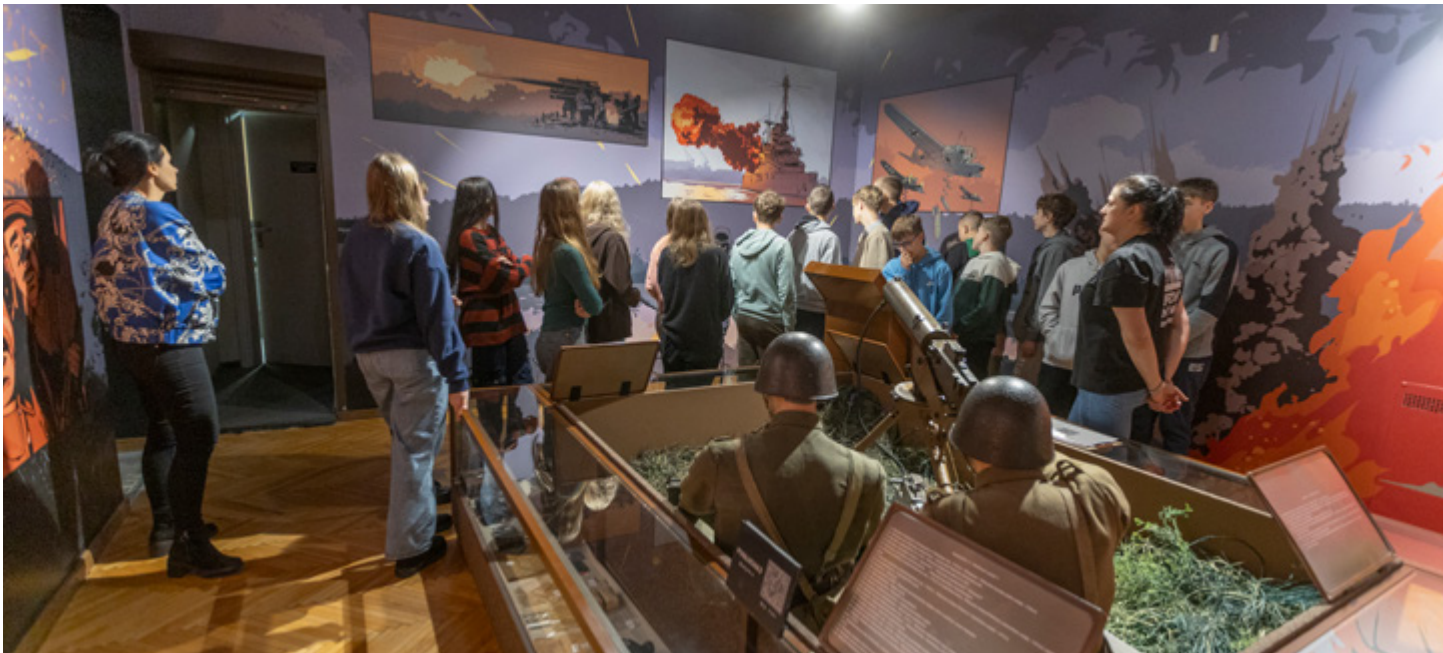
Młodzież podczas warsztatów w Muzeum Wojska w Białymstoku.

Warsztaty mogą być realizowane z uczniami ostatnich klas szkoły podstawowej oraz uczniami szkół ponadpodstawowych.