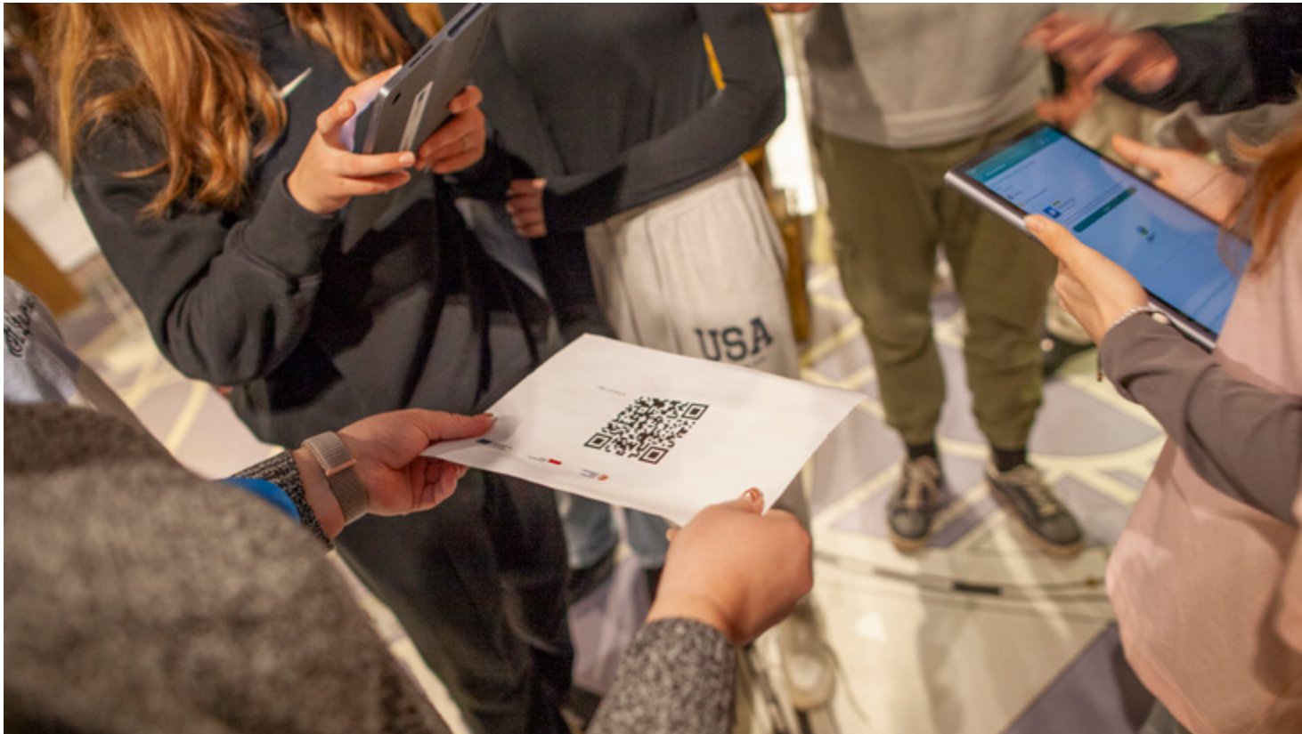
Skanowanie kodów QR podczas warsztatów w Muzeum Wojska w Białymstoku.

7. Na koniec poproś uczestników by podzieli się co najbardziej utkwiło im w pamięci po warsztatach.