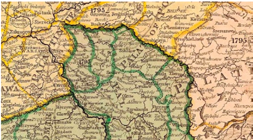
Mapa 1: Północny przebieg granicy Cesarstwa Austriackiego w latach 1795–1809. Fragment mapy Williama Fadena, A map of the Kingdom of Poland and Grand Duchy of Lithuania including Samogitia and Curland, divided according to their dismemberments with the Kingdom of Prussia , London 1799.

okupantów Rzeczypospolitej. Region ten do 1795 r. wchodził w skład czterech województw koronnych: sandomierskiego (ziemia stężycka), lubelskiego (ziemia łukowska), podlaskiego (zachodnia część ziemi drohiczej i południowa część ziemi mielnickiej) oraz mazowieckiego (z zachodnimi częściami ziemi warszawskiej i czerskiej, całą ziemią liwską i zachodnią częścią ziemi nurskiej) oraz jednego województwa litewskiego – zachodniego skraju województwa brzesko-litewskiego. Głównymi i największymi miastami opisywanego terenu (przyjmując kryterium liczby ludności miast) były: Międzyrzec, Węgrów, Siedlce, Biała, Łuków, Sokołów, Liw i Garwolin 2 . Warto dodać także, że do 1795 r. Siedlce, Stanisławów czy Biała nie były ośrodkami lokalnych ziem, były nim Liw, Drohiczyń i Mielnik 3 . Władze austriackie, które objęły tereny leżące między Wisłą, Bugiem i Wieprzem zmuszone zostały do reorganizacji centrów administracyjnych nowo zdobytych ziem, ponieważ staropolski podział administracyjny nie pokrywał się z analogicznym podziałem zaborców. Położenie geograficzne sprawiło zatem, że miasta: Siedlce, Biała i Stanisławów zyskały na znaczeniu i zastąpiły w tym względzie właśnie Liw, Mielnik i Drohiczyń 4 .