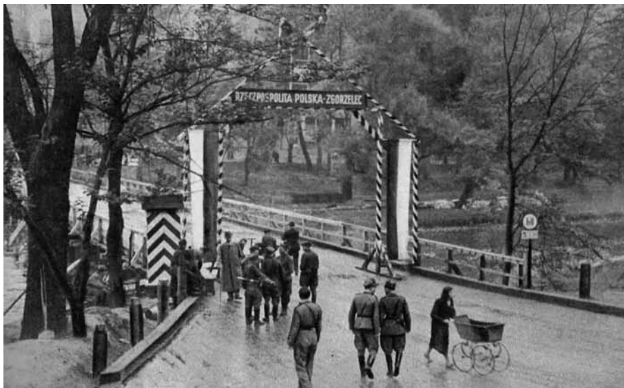
Fot. 1. Przejściowy punkt kontrolny w Zgorzelcu w 1945 r.

Przejęcie przez jednostki taktyczne 2. Armii wyznaczonych odcinków granicy państwa nie rozwiązywało jednak problemów związanych z jej ochroną, wynikających m.in. z braku doświadczenia, niewłaściwej organizacji systemu ochrony, samowoli jednostek i pododdziałów Armii Czerwonej, jak też specyfiki granicy zachodniej. Widoczne to było zwłaszcza na odcinku granicy biegnącej wzdłuż Nysy Łużyckiej, gdzie w całej rozciągłości wystąpiły niedomagania systemu ochrony granic, które związane były z niskim stanem wód nie stanowiącym większej przeszkody. Efektem tego był napływ na wschodnią stronę rzeki niemieckich uciekinierów próbujących przedostawać się na opuszczone przedtem tereny. W tej sytuacji postanowiono w celu niedopuszczenia do powrotu ludności niemieckiej przystąpić do drugiego etapu organizacji systemu ochrony granicy państwa – zorganizowania ochrony granicy na Nysie Łużyckiej po zachodniej stronie rzeki.