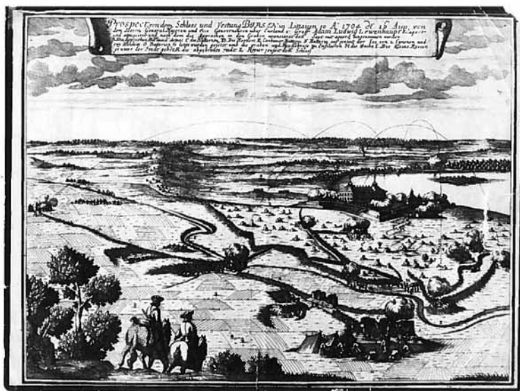
Atak na Zamek Birże w dniu 16 sierpnia 1704 r. według szwedzkiego rytownika