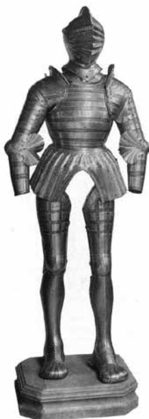
Ryc. 28. Zbroja kostiumowa (G. L. Niox, op. cit., s. ryc. X)