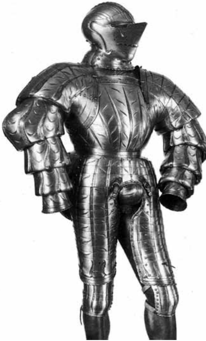
Ryc. 37. Zbroja kostiumowa Wilhelma von Rogendorfa (B. Thomas, O. Gamber, Katalog der... , ryc. 119, s. 227-228)

Metropolitan Museum of Art w Nowym Jorku (nr inw. 42.50.24a, b) 146 . Z powyższego wynika, że zbroja z Warszawy posiadała dwa typy naleęczaków – kostiumowe i konwencjonalne.