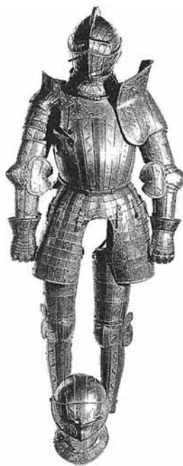
Ryc. 21. Zbroja kostiumowa (O. Gamber, Der Harnisch... , ryc. 11)

Guidobaldo II Della Rovere (1514-1574, książę Urbino od 1538 r.), i znajdującym się obecnie w Galerii Pitti we Florencji (nr inw. 142) 80 (Ryc. 20). Zielona półzbroja ma napierśnik pokryty dekoracją wyglądającą jak pocięty brokatem kaftan z szczerelinowymi wzorami w kształcie litery S. Zbroję noszono na purpurowym kaftanie a parę szkarłatnych pończoch, kunsztownie haftowanych złotą nitką, uwypuklono w kroczu wydatnym saczkiem 81 . Ze względu na to, że takie samo zdobienie znajduje się już w kostiumie portretu włoskiego datowanego na 1527 r., można przyjąć, że przedstawiona zbroja powstała pomiędzy 1525 a 1530 r. 82