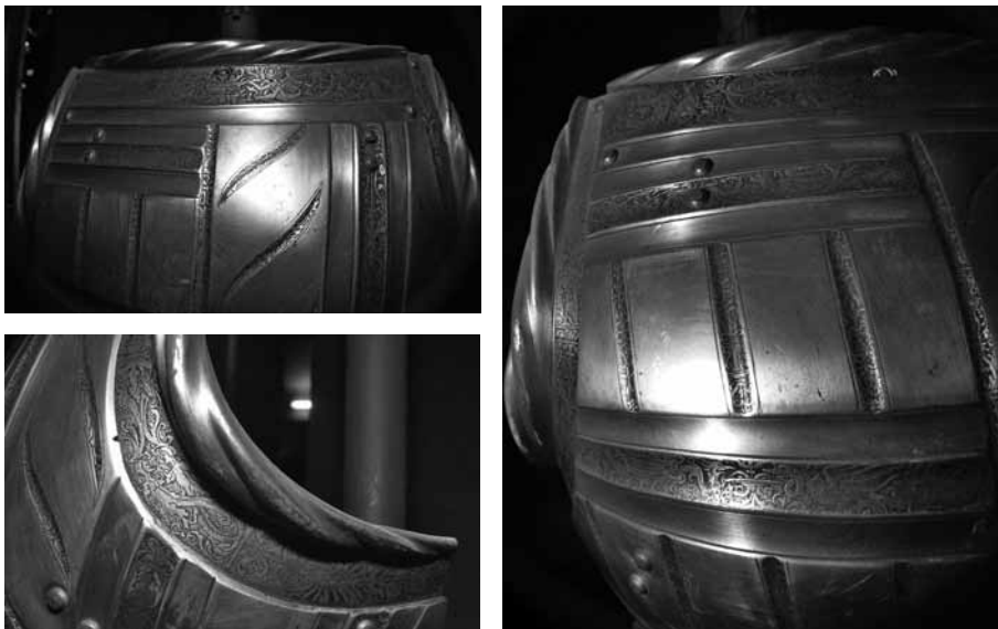
Ryc. 35a., 35b., 35c. Dekoracja napierśnika