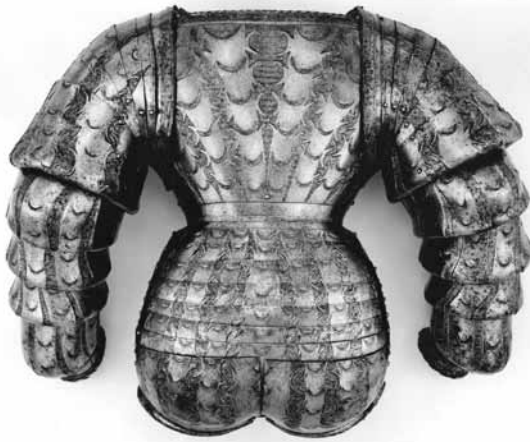
Ryc. 38. Zbroja kostiumowa