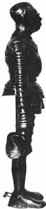
Ryc. 32. Zbroja kostiumowa ( Riddarlek och Tornerspel... , 1992, nr kat. 107)

Datowanie tego kompletu przyjmuje się na przedział czasowy 1510-1515.