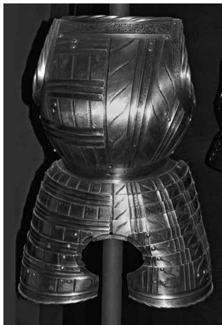
Ryc. 35. Napierśnik, fartuch i taszka zbroi kostiumowej

Półbroja w podobnym typie, znajduje się w Wallace Collection w Londynie (nr inw. A 28) 125 (Ryc. 34). Cała jej powierzchnia jest tłoczona w poziome pasy imitujące dmuchany i cięty kostium. W cięciach występuje krzyżowo-kreskowe trawienie, naśladujące adamaszek lub aksamit a ich brzegi wykończone są ząbkami. Skraje dmuchanych pasów podkreślone są przez długie tłoczone sznury. W poziomych pasach, pomiędzy dmuchanym ornamentem, występuje trawiona dekoracja w postaci liści, kwiatów i półksiężyców na groszkowej powierzchni. W pionowych pasach pachowych wytrawiono morskie potwory oraz głowy cherubinów widziane z profilu. Obwódka w talii wykonana jest z podwójnej taśmy z falistym ornamentem. Zbroja datowana jest na rok 1520. Wykonawstwo przypisywane jest warsztatowi augsburskiemu, a dekoracja – Danielowi Hopferowi starszemu 126 .