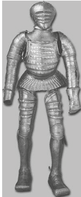
Ryc. 30. Zbroja kotiumowa (Eisenkleider..., ryc. 70)

Zbroja o podobnym przeznaczeniu oraz podobnej budowie i dekoracji, znajduje się w Niemieckim Muzeum Historycznym