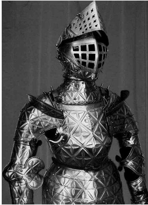
Ryc. 19. Zbroja chłopięca króla Zygmunta II Augusta

zeti Múzeum) (nr inw. 55.3269) 76 (Ryc. 19). Jest ona uważana za pierwsze wielkie dzieło tego płatnerza. Przez rozszyfrowanie inicjałów ES i SE (Elisabetha, Sigismundus), oraz odnalezieniu źródeł pisanych, zbroja ta została definitywnie przypisana Zygmuntowi II Augustowi. Wykonano do niej dwa siodła, z których zachowało się jedno 77 . Wątpliwości istnieją tylko co do tego, czy faktycznie została przekazana na dwór krakowski 78 . Jej ornamentyka pokazuje rozcięty strój z epoki i może nawiązywać do czterolistnej koniczyny, symbolu szczęścia. Jeśli nie przynosi ona szczęścia bezpośrednio, w charakterze magicznego amuletu, jest silnym, pozytywnym symbolem. Dlatego zapewne została wykonana na zbroi.