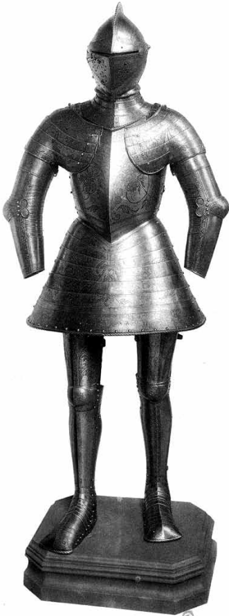
Ryc. 5. Zbroja ze spódniczką. Muzeum Armii w Paryżu (G. Niox, op. cit., s. ryc. VIII)

VEULT (miłości nie można domagać się okrucieństwem). Symetryczne naramienniki połączono z naręczakami z wypełnieniem wielowarstwowym w stawach łokciowych (obecnie brak rękawic). Na pionowym pasie napierśnika znajduje się chrystogram