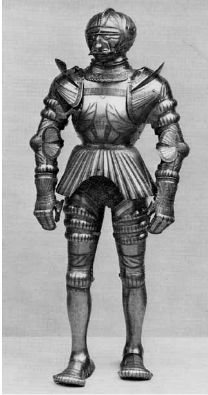
Ryc. 26. Zbroja księcia Pruskiego, Albrechta Hohenzollerna (S. V. Grancsay, op. cit., nr kat. 4)

Mistrzowi Zakonu Krzyżackiego (1511-1525, od 1525 książę Prus) 105 . Wykonano ją z błyszczącej, polerowanej stali, a ponadto jest wytłaczana, trawiona i złożona. Przedstawia dmuchaną i ciętą imitację ekscentrycznego i modnego ubioru tego okresu. Zasłona hełmu jest wytłaczana i przedstawia twarz człowieka z oczami, orlim nosem, wąsami i ustami 106 (Ryc. 26). Na wymiennym napierśniku tej zbroi, znajdującym się w Państwowych Zbiorach Sztuki w Dreźnie (Statliche Kunstsammlungen Dresden) (nr inw. M 142) 107 również wybito markę Kolmana Helmschmida 108 . W poziomej, górnej listwie wytrawione są litery dewizy GVDMTE , które można rozszyfrować dwojako: GRATIA VERBUNQUE DOMINI MANET TIBI ETERNE (łaska i słowo Pana będzie trwać wiecznie) lub GENEROSO VIRO DEUS MAXIMUM TUTAMEN EST (szlachetnego męża Bóg jest najlepszą ochroną) 109 (Ryc. 26a). W centralnej części umieszczono krzyż nadany przez papieża Celestyna III (1191-1198) rycerzom Zakonu Szpitala Najświętszej Marii Panny Domu Niemieckiego w Jerozolimie 110 . W środku krzyża widnieje tarcza z pruskim orłem. Przedstawiona na nim brokatowa dekoracja, trawiona na kreskowej powierzchni, występuje również na „zbroi legnickiej” i zbroi chłopięcej Karola V 111 . Prawdopodobnie była darem cesarza Maksymiliana I dla Albrechta, nowego mistrza Zakonu Krzyżackiego. Zamówiona została w 1511 r. i wykonana