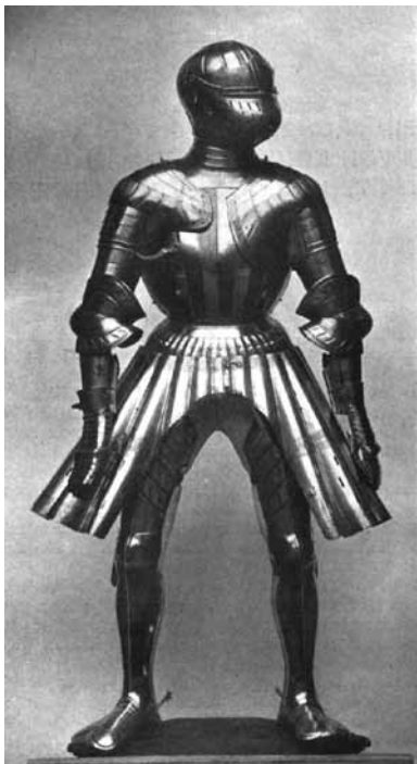
Ryc. 15. Zbroja księcia legnicko-brzeskiego Fryderyka II (P. Post. Ein Frührenaissance-Harnisch... , ryc. 1, s. 168)