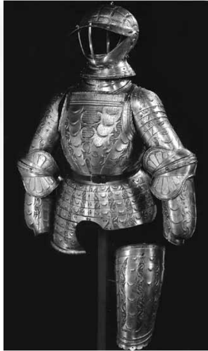
Ryc. 38a. Alternatywne części zbroi radziwiłłowskiej (J. P. Reverseau, op. cit., s. 132)

Zbroja, znana w literaturze przedmiotu jako radziwiłłowska, podzielona jest między Paryż a Nowy Jork. Metropolitan Museum of Art w Nowym Jorku, posiada naplecznik z ochroną pośladków, naręczniki i opachy (nr inw. 24.179; 26.188.1–2; 29.158.363a, b) 156 (Ryc. 38). Paryskie Musée de l'Armée przechowuje hełm, napierśnik z taszkami (prawej taszce brakuje trzech folg), naręczniki kostiumowe i lewy nabiodrek (nr inw. 45) 157 (Ryc. 38a). Podobnie jak jej wiedeński odpowiednik, nie ma żadnych znaków płatnerskich, ale jakość wykonania wskazuje na augsburskiego płatnerza Kolmana Helmschmida.