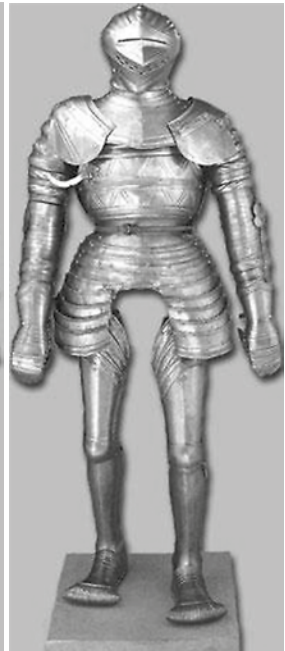
Ryc. 31. Zbroja kotiumowa (Eisenkleider..., ryc. 89)

w Berlinie (Deutsches Historisches Museum) (nr inw. W 2326) 119 (Ryc. 30). Napierśnik i nabiodrki posiadają dekorację dmuchaną i ciętą, ale w bardzo ubogiej formie. Interesującym elementem jest fartuch wykonany w kształcie bardzo krótkiej, plisowanej spódniczki. Wykazuje on podobieństwo do zbroi z Nowego Jorku 120 (Ryc. 26).