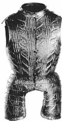
Ryc. 22. Napierśnik kostiumowy (M. Scalini, op. cit., fig. 1, s. 38)

obończyka, a owalny, mocno wybrzuszony napierśnik sięga aż do szyi. Hak na kopię jest składany i utrzymywany w ustalonej pozycji przy pomocy sprężyny blokującej. Z fartucha zwisają długie, wysunięte prosto w dół taszki. W miejsce starych rękawic mitynek, zbroja posiada rękawice z palcami (palców obecnie brak). Także hełm z wygiętym lukowo konturem zasłony ma nowy elegancki fason. Na lewym naramienniku znajduje się dodatkowa płyta wzmacniająca. Motywem zdobniczym są arabeski i spiralnie ukształtowane na gładkiej powierzchni gałązki 85 . Zbroja datowana na 1525-1530 r. jest roboty włoskiej. Podobnie jak zbroja Guidobaldo Della Rovere posiada w pasach esowato ciętą dekorację.