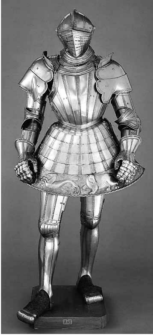
Ryc. 6. Zbroja ze spódniczką z garnituru „ze zwierzętami łownymi” (Dominguez Ortiz, C. Herrero Carretero, J. A. Godoy, op. cit., s. 139)