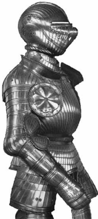
Ryc. 17. Zbroja maksymiliańska z elementami kostiumowymi (J. Schöbel, op. cit., nr kat. 3)