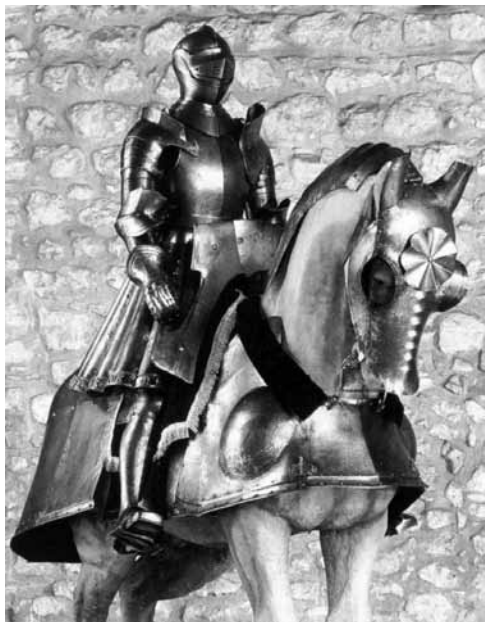
Ryc. 13. Zbroja króla Anglii Henryka VIII (D. Edge, J. M. Paddock, op. cit., s. 146)