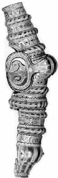
Ryc. 39. Naręczaki kostiumowe (A. Jubinał, G. Sensi, op. cit., ryc.12)