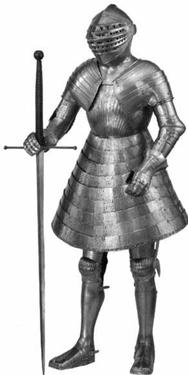
Ryc. 3. Zbroja króla Anglii Henryka VIII (D. Edge, J. Paddock, op. cit., s. 170)

i z tyłu do naplecznika. Naramienniki są bardzo duże, symetryczne, sięgające pasa, z tyłu zakrywają prawie całe plecy, tworząc dodatkową wielowarstwową ochronę.