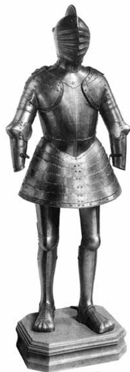
Ryc. 4. Zbroja ze spódniczką. Muzeum Armii w Paryżu (G. Niox, op. cit., s. ryc. VII)

Dwie tego typu zbroje posiada paryskie Muzeum Armii (Musée de l'Armée). Pierwsza z nich została opisana jako wyrób francusko-włoski z lat 1540-1550 (nr inw. G 181) 22 (Ryc. 4). Posiada ona hełm zamknięty razem z osłoną gardłową, przyśrubowany do napierśnika i naplecznika oraz zasłonę w kształcie kowalskiego miecha, złożoną z czterech rzędów poziomych otworów wzrokowych i oddechowych. Na grzebieniu hełmu w kartuszu widnieje napis: AMOUR NE PEULT OU RIGEUR