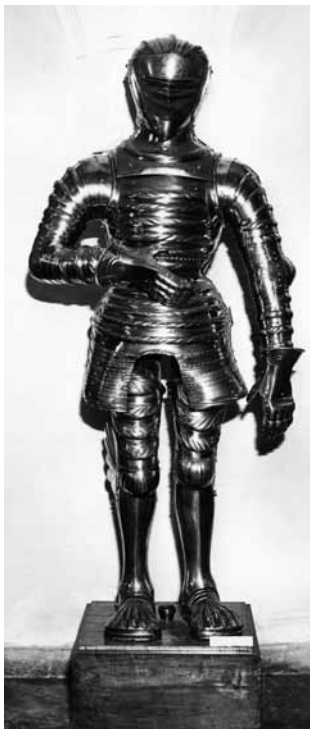
Ryc. 33. Zbroja kostiumowa z Sankt Petersburga. Tu w czasie prezentacji na ekspozycji czasowej w Muzeum Miejskim Wrocławia w 1975 r. (Muzeum Miejskie Wrocławia)