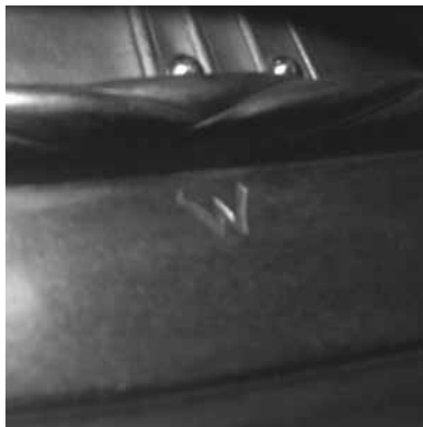
Ryc. 25b. Marka W na napleczniku kostiumowym