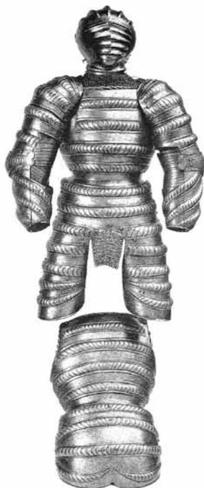
Ryc. 34. Zbroja kostiumowa (J. Mann, The Wallace Collection Catalogues... , vol. I, plate 14, s. 26-27)

w których naręczaki wykonane są w kształcie rękawów. Zalicza się do nich zbroja przechowywana w Sankt Petersburgu 124 (Ryc. 33), chociaż jej dekoracja jest dość uboga. Dmuchaną i ciętą ornamentykę, zastosowano na napierśniku, napleczniku, naręczakach i nabiodrkach. Cięcia wykonano pod kątem 45°, naprzemiennie na co drugim zgrubieniu. Otwory do montowania haka na kopię umieszczone z prawej strony napierśnika wskazują, że jest to zbroja jeździecka. Jej naręczaki wykonano w kształcie rękawów kostiumu z epoki, dopasowując je do kirysu szwem imitującym okrągłe zgrubienie. Wewnątrz stawów łokciowych wbudowano wypełnienie wielowarstwowe, zabezpieczone dodatkowo małymi muszelnkami nałokcic z karłowatymi, sercowatego kształtu skrzydełkami.