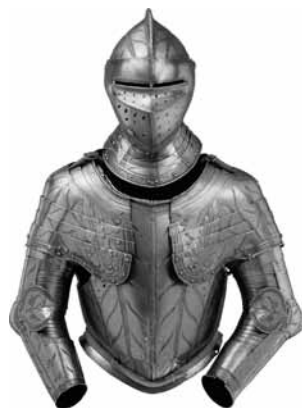
Ryc. 24. Półzbroja kostiumowa

Drugi przykład to napierśnik i naplecznik z folgowymi taszkami z tej samej kolekcji (nr inw G 12) 86 (Ryc. 22) i przynależna do tego zestawu nałockica, własność Museo Stibbert we Florencji (nr inw. 945) (Ryc. 23). Ze znakiem zapytania przypisywana jest warsztatowi rodziny Negroli 87 i datowana na lata 1530-1535 88 .