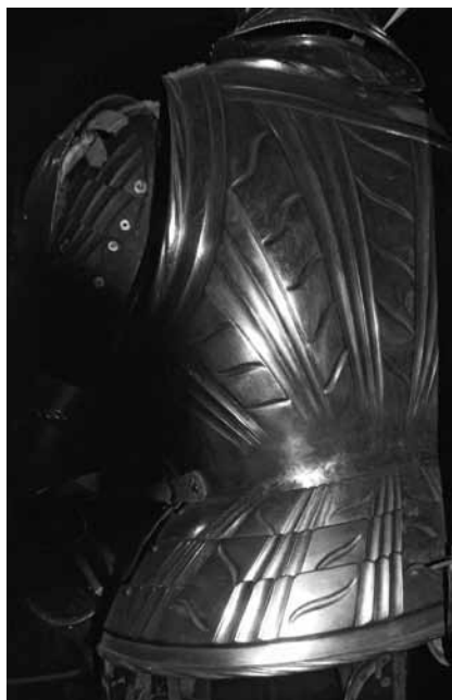
Ryc. 25, 25a. Naplecznik zbroi kostiumowej (fot. M. Cieśla)